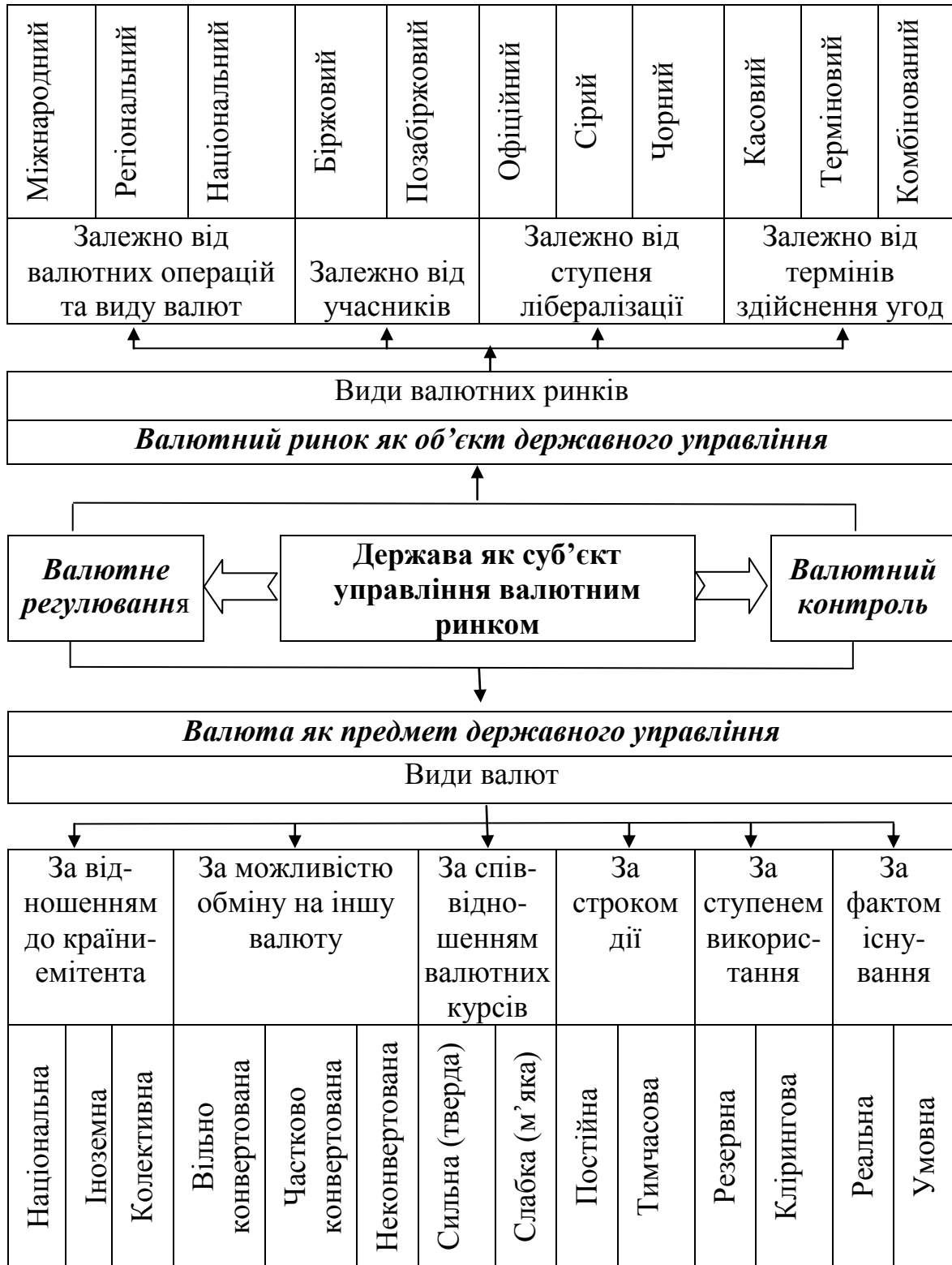
Рис. 1. Основні елементи механізму державного управління валютним ринком

За своїм призначенням й організаційною формою валютний ринок містить сукупність спеціальних інститутів та механізмів, які у взаємодії забезпечують можливість вільно продати-купити національну й іноземну