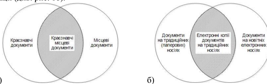
а) Рис. 1. Складові краєзнавчого фонду бібліотеки:

Другий важливий параметр, за яким розподіляються краєзнавчі документи, – це матеріальні носії інформації (див. рис. 1б).