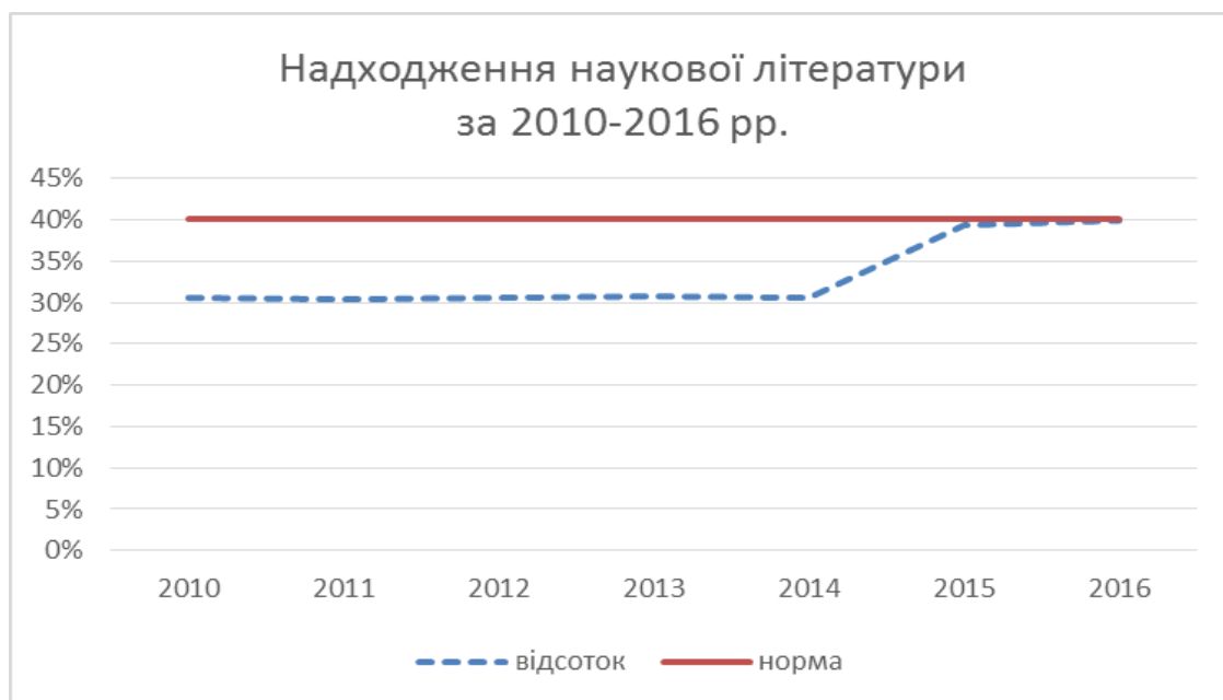
Рис.1. Надходження наукової літератури до НБ МДУ за 2010 – 2016 рр.

Перевага у комплектуванні фонду Наукової бібліотеки МДУ надається якісному, а не кількісному напрямку у комплектуванні фонду. Пріоритет у комплектуванні становить наукова література близько 40 % від загального фонду. На рисунку 1 відображено зростання кількості надходжень наукової літератури на протязі 2010 – 2016 рр.. Потрібно відмітити, що бібліотека досягла норми комплектування бібліотек закладів вищої освіти науковою літературою, яка складає 40 %.