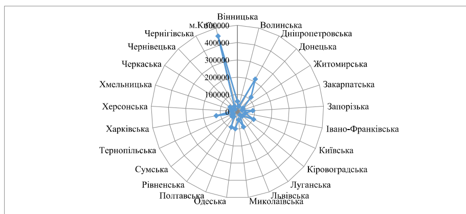
Рис.4.2. Розподіл валового регіонального продукту за регіонами України, 2015 р. (млн.грн)

Регіонами-лідерами за показником валового регіонального продукту є Дніпропетровська (10,83%), Донецька (5,78%), Київська (5,23%), Львівська (4,76%), Полтавська (4,82%), Харківська (6,28%) області та м.Київ (22,72%), які разом виробляють майже 61% сукупного ВРП (рис.4.2)