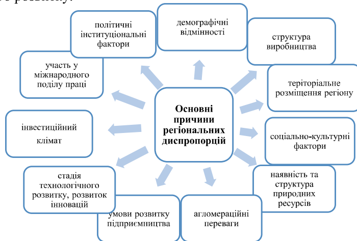
Рис.4.1. Основні причини регіональних диспропорцій

інвестицій; рівень безробіття. Зазначені та інші характеристики застосовуються різними дослідниками для оцінки диспропорцій регіонального розвитку.