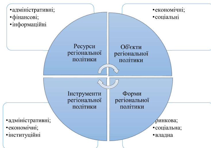
Рис. 4.4. Механізм реалізації державної регіональної політики

Отже, економіка регіонів у сучасній Україні характеризується незбалансованим розвитком та неоднорідністю соціально-економічного становища окремих частин країни. Комплексне управління регіоном передбачає активізацію внутрішніх зусиль кожного регіону для досягнення власних цілей розвитку.