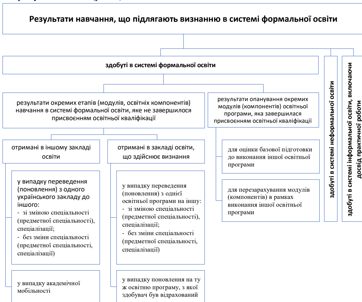
Рис. 2. Результати навчання як об’єкт визнання

Результати навчання, яке не завершилося присвоєнням повної освітньої кваліфікації, або здобуті на певному етапі (при опануванні модуля, компонента) освітньої програми, виконання якої завершилося присвоєнням повної освітньої кваліфікації, є по суті здобутою частковою освітньою кваліфікацією, що потребує визнання (рис.2).