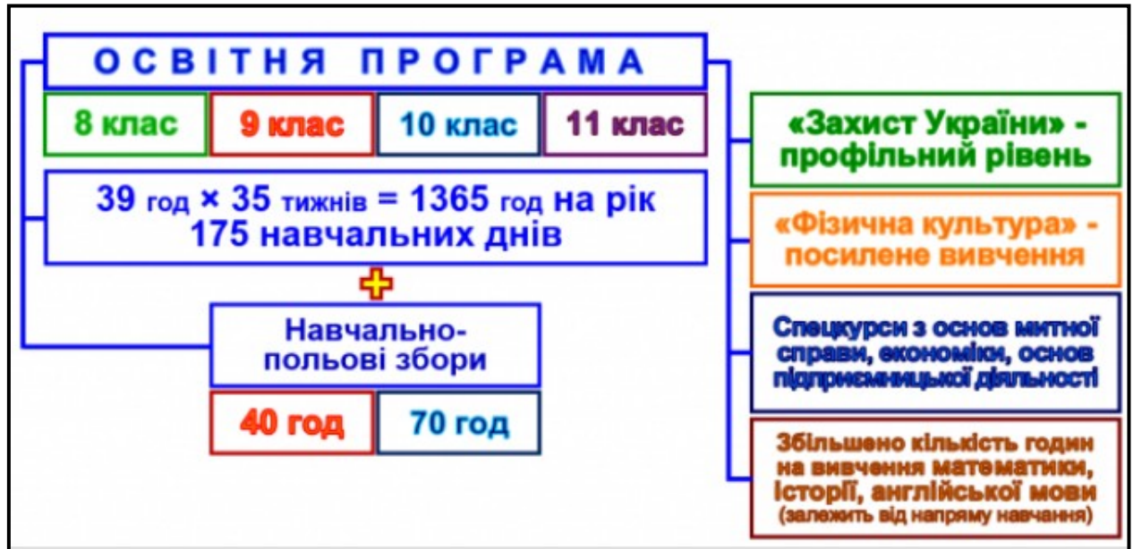
Рис.2.3. Приблизна Структура освітньої програми Донецького обласного ліцею-інтернату з посиленою військово-фізичною підготовкою ім. Г. Т. Берегового

інструкції з організації і планування освітнього процесу і базового навчального плану.