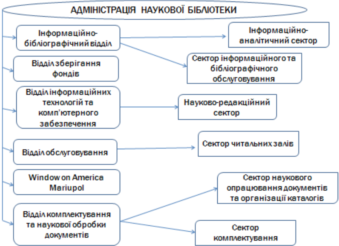
Рис. 3.1 Структура наукової бібліотеки Маріупольського державного університету