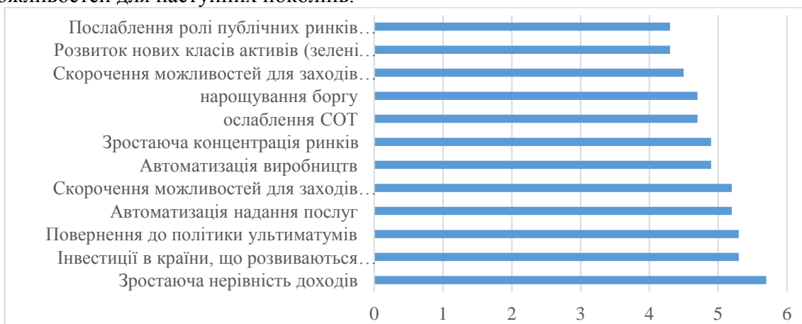
Рис 1. Глобальні детермінанти розвитку світової економіки

На глобальному рівні конвергенція доходів – зближення рівня життя в країнах, що розвиваються з рівнем розвинених – зупинилася: цифрова революція не приносить прискорення зростання біднішим країнам, як це було при розвитку технологій 1990-х і 2000-х рр. У свою чергу, перед великими ринками, що розвиваються у найближчому майбутньому може виникнути проблема середнього доходу. Хоча цифровізація спочатку відкрила безліч можливостей для зростання мікропідприємництва на основі інноваційного підприємництва та використання стартап технологій для створення нових видів бізнесу і тим самим виходу з бідності та як наслідок підвищення рівня життя, разом з тим одночасно з цифровими технологіями розвивається тенденція «переможець отримує все» здатна заблокувати шляхи до нових можливостей для наступних поколінь.