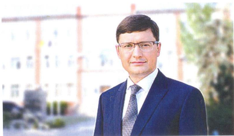
Городской голова Мариуполя Вадим Бойченко: «Открытость и информированность населения – девиз городской власти».