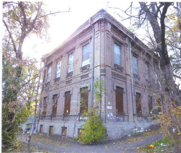
Здание бывшего радиоузла по ул. Пушкина, 82 медленно и уверенно разрушается.

В 2014 году, когда в регионе началась антитеррористическая операция, Донецкая облтелерадиокомпания вынуждена была переселиться в г. Краматорск и «Радио Приазовья» в качестве областного выходило в эфир на частоте 67.34 мГц, рассказывая жителям Юга Донбасса о ситуации в зоне АТО, о новостях последних дней в Мариуполе и регионе, транслировало «Хроники Донбасса» от «Громадського радіо».