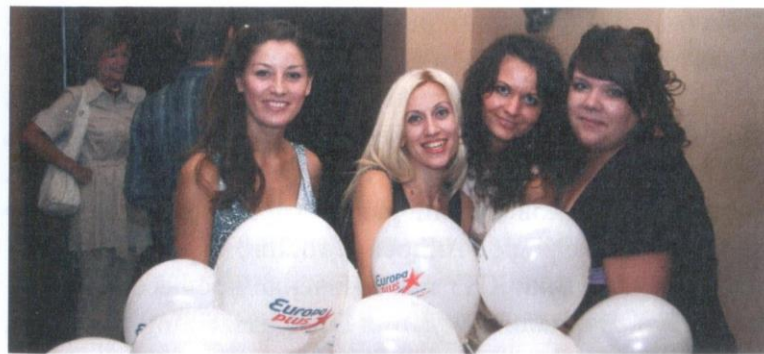
День рождения Europa Plus.

тивности работы радиостанции, для улучшения качества радиоэфира и рекламной деятельности была организована экспериментальная площадка. На «Евростудии» появились инновационные грантовые, муниципальные и образовательные проекты, проходили апробацию научные исследования магистров и аспирантов МГУ, обучавшихся по специальностям «Журналистика», «Реклама и связи с общественностью». «Евростудией» был заключён договор с кафедрой социальных коммуникаций Мариупольского государственного университета. Это единственный пример подобного сотрудничества в Украине, когда будущие специалисты в области медиа (журналисты, рекламисты, ведущие, корреспонденты, редакторы) практикуются в условиях работы реально действующей на основе лицензии Национального совета по телевидению и радиовещанию радиостанции и обеспечивают её жизнедеятельность. Благодаря этому в программной сетке вещания появились авторские информационно-аналитические, научно-просветительские, культурно-развлекательные программы для мариупольцев, эфирные акции, квесты и радиомарафоны, организованные молодыми журналистами, рекламистами и пиарщиками.