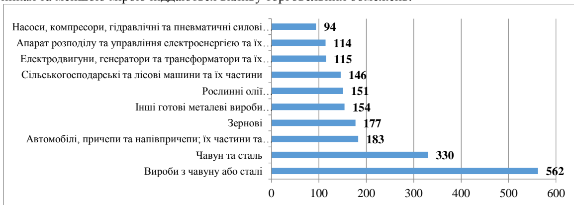
Рис. 3. Топ-10 товарних груп України, до яких країнами світу застосовано протекціоністські заходи (2009-2018 рр., од.)

Щодо товарних груп, до яких дискримінаційні заходи країнами світу застосовувалися найбільше, то це металургійна продукція, продукція машинобудування та продукція сільськогосподарства (зернові, олійні культури), які складають основу українського експорту (рис.3). Стабільність економіки країни значною мірою визначається якістю структури її експорту. На жаль, Україна має не багато експортних товарних позицій з високим рівнем доданої вартості, які мають постійний та стабільний попит на зовнішніх ринках та меншою мірою піддаються впливу торговельних обмежень.