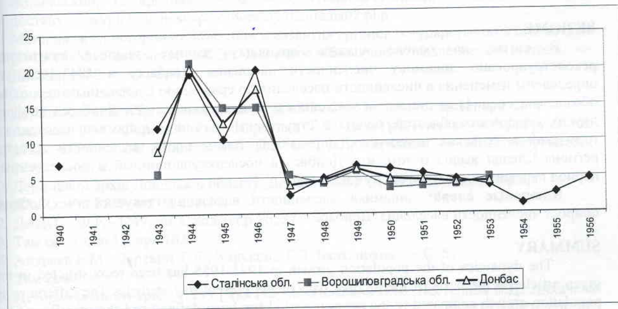
Графік 2. Темпи щорічного приросту чисельності населення Донбасу в 1943-1955 рр. (%) [33]

За темпами збільшення чисельності населення регіону можна виділити два періоди. Перший – осінь 1943-1946 рр. - характеризується максимальними щорічними темпами приросту від 9 до 20 % та значним його коливанням. Лише за декілька місяців після визволення від окупації у 1943 р. населення Сталінської обл. зросло на 12 %, Ворошиловградської обл. – на 5,5 %, у 1944 р. мешканців Донбасу протягом року побільшало на 20, у 1945 р. – на 13, у 1946 р. – 17 %. Загалом наслідком першого періоду стало бурхливе зростання чисельності населення Донбасу на 1846,7 тис. осіб, або на 74,5 %, що відбувалось, головним чином за рахунок незрівнянно великих за чисельністю міграційних потоків.