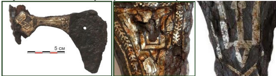
Рисунок 3. Суздальська сокира XI ст. з курганного могильника поблизу села Шекшово (Іванівська область, Росія) [11].

На сайті Інституту археології Російської Академії наук розташована публікація про знахідку влітку 2011 р. Суздальською експедицією залізної інкрустованої сріблом сокири XI ст. з одночасним зображенням двох княжих знаків – двозуба і тризуба [11]. Якщо тризуба тамга з трикутником на середньому зубці могла належати одному з найближчих родичів князів Володимира і Ярослава, то двозуб на сокирі розглядається авторами публікації як загальний знак роду Рюриковичів. Коментуючи цю унікальну знахідку (рис. 3) в інтерв'ю журналісту РІА «Новості», академік М. О. Марков зазначив, що це перший зафіксований археологією випадок розташування княжих знаків на парадній зброї, яка виступала як символ влади. За словами вченого, «ети знаки – знаки собственности, некая личная печать. Княжеские знаки – это эмблематика династии, это эмблематика очень узкого круга людей. Есть предположение о сарматском происхождении (знаков), писалось о хазарском происхождении, но точно это неизвестно. Мы знаем, что у скандинавов таких знаков нет, у славян таких знаков нет, это изобретение появляется у Рюриковичей на Руси X века» [12].