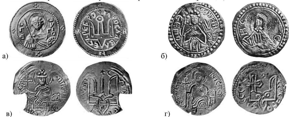
Рисунок 1. Найдавніші руські монети X-XI ст.ст. [20]:

Важко переоцінити його значущість і в контексті еволюції сучасних символів української державності. 22 березня 1918 р. «знак Київської держави Володимира Святого» був затверджений Центральною Радою як герб Української Народної Республіки [5, с. 99-101]. Після поразки української революції «тризуб» залишився символом українського національного руху різних політичних орієнтацій. Тому його затвердження головним елементом державного герба України [10, ст. 20] символізує зв'язок з державотворчими традиціями Київської Русі та боротьбою за українську державність у XX ст. Тризуб - головний елемент державного гербу України - копіює княжий знак срібників IV типу Володимира Святославича (рис. 1, в).