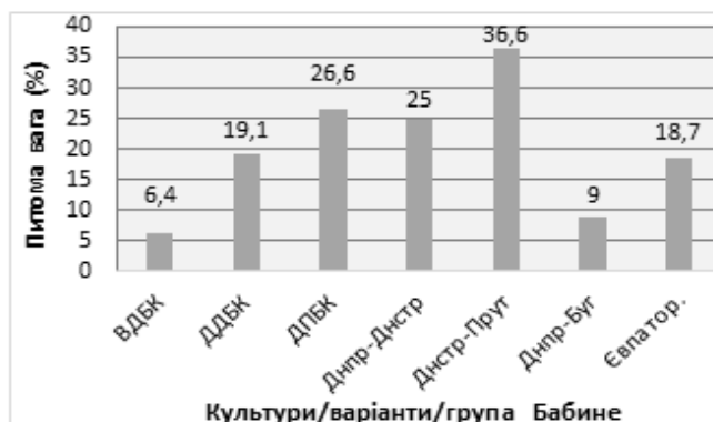
Рис. 1. Питома вага поховань з керамікою в регіональних групах культурної області Бабине

З трьох бабинських культур найрідше застосовувався керамічний посуд у складі поховального реманенту носіями ВДБК (у кожному шістнадцятому похованні) [9, с. 169] 1 , а найчастіше – людністю ДПБК (усереднено в кожному четвертому). При цьому серед трьох локальних варіантів останньої спостерігається певна нерівнозначність у частоті цієї практики. Так, дніпро-дністровські степові могильники ДПБК демонструють найвищий показник не лише по культурі, а й усій культурній області (частіше, ніж у кожному третьому похованні), тоді як її дніпро-бузькі лісостепові некрополі дають один з найнижчих по культурній області показників (кожне одинадцять поховання) [6, с. 8-10; 8, с. 116, 118, 121]. У пам'ятках своєрідної євпаторійської групи Криму і Нижньої Наддніпряни керамічний посуд трапляється майже в кожному п'ятому захороненні [7, с. 32].