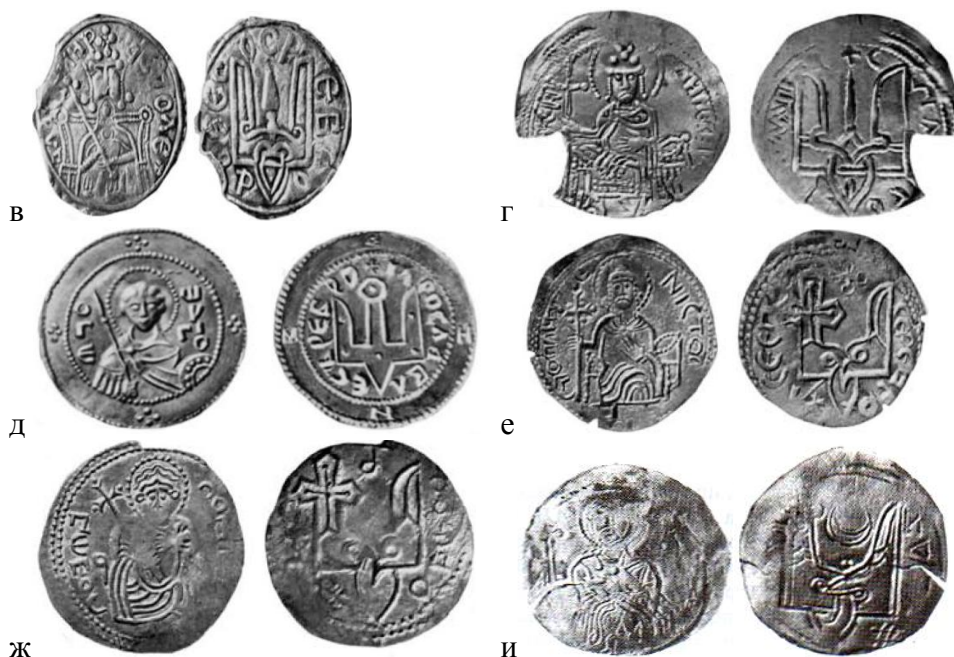
Рис. 1. Знаки Рюриковичей на древнейших русских монетах X – XI вв. [12]:

а-г – сребреники Владимира Святославича († 1015); д – сребреник Ярослава Владимировича († 1054); е-и – сребреники Святополка Окаянного († 1019).