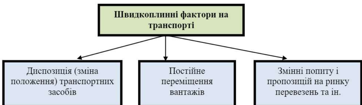
Рисунок 3 - Швидкоплинні фактори на транспорті

ІТ життєво необхідні на транспорті з його швидкоплинними факторами (рисунок 3).