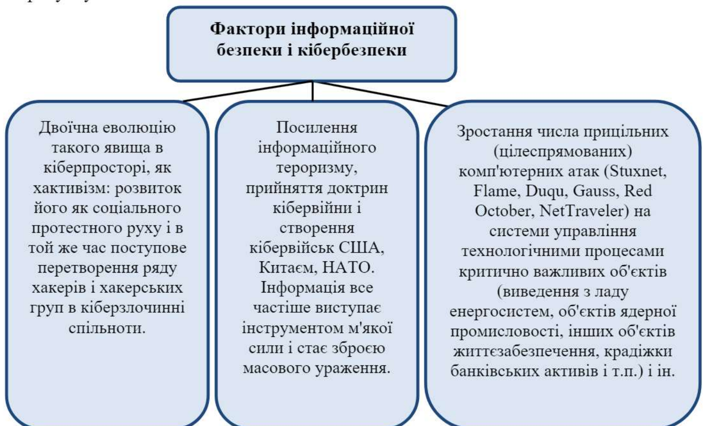
Рисунок 4 - Фактори інформаційної безпеки і кібербезпеки

Основні фактори інформаційної безпеки і кібербезпеки зображені на рисунку 4.