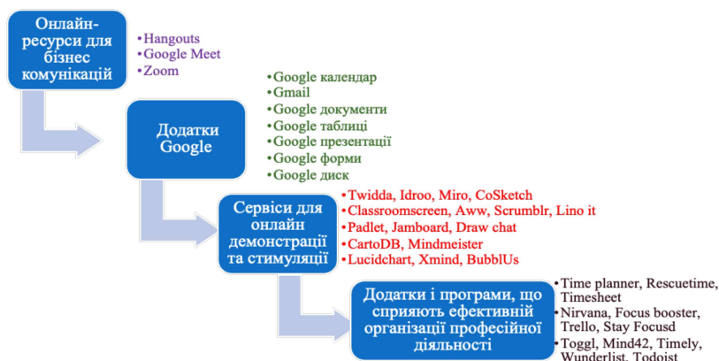
Рис. 3. Комунікативні інструменти та технології ефективного дистанційного менеджменту в середовищі креативних індустрій.

що сприятиме підвищенню ефективності професійної діяльності у віддаленому форматі, безперервному професійному розвитку, підвищенню кваліфікації фахівців, формуванню конкурентоздатності та досягненню успішності в кар'єрі. Враховуючи специфіку діяльності в креативних індустріях, доречно виокремити комунікативні інструменти для забезпечення реалізації дистанційного менеджменту як це зображено на рис.3.