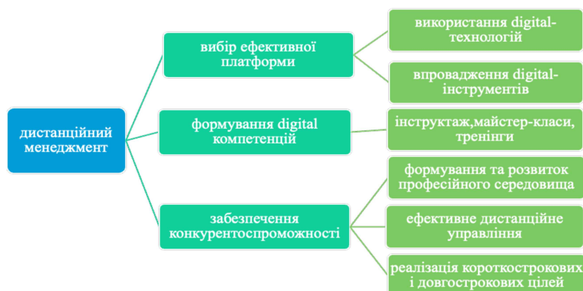
Рис. 2. Дорожня карта реалізації дистанційного менеджменту в середовищі креативних індустрій.