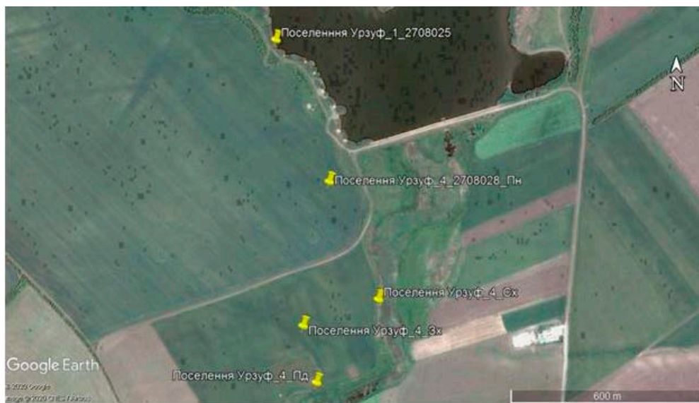
Рис. 6. Схема розташування археологічного об'єкту поселення «Урзуф-4» за супутниковою картою Google Maps