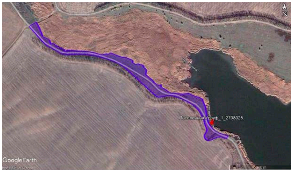
Рис. 5. Схема розташування археологічного об'єкту поселення «Урзуф-1» за супутниковою картою Google Maps

ведення товарного сільськогосподарського виробництва (кадастровий № 1423985500:03:000:2606) Урзуфської сільської ради Мангушського р-ну Донецької обл. за межами населених пунктів, було проведено натурне обстеження об'єктів археологічної спадщини. При цьому було встановлено наступне. На території ділянки за даними обмеженого натурального археологічного обстеження пам'яток археології, Публічної кадастрової карти та планово-картографічного матеріалу встановлено наявність археологічного об'єкта – поселення (рис. 4; 6).