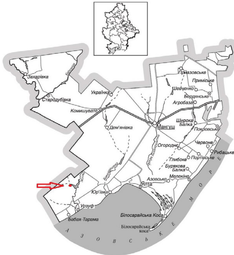
Рис. 3. Схема розташування археологічних об'єктів – поселень «Урзуф-1» та «Урзуф-4» на мапі Мангушської ОТГ Маріупольського району Донецької обл.