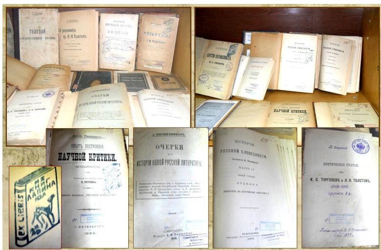
Рис. 4. Личная коллекция А. М. Лапина

Настоящие книжные редкости содержит коллекция А. М. Лапина, подаренная библиотеке, предположительно, его сыном – Ю. А. Лапиным (рис. 4).