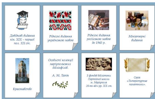
Рис. 1. Коллекции фонда редкой и ценной литературы НБ МГУ

Особого внимания в ФРЦК заслуживают две книги из коллекции «Редкие издания на украинском языке»,