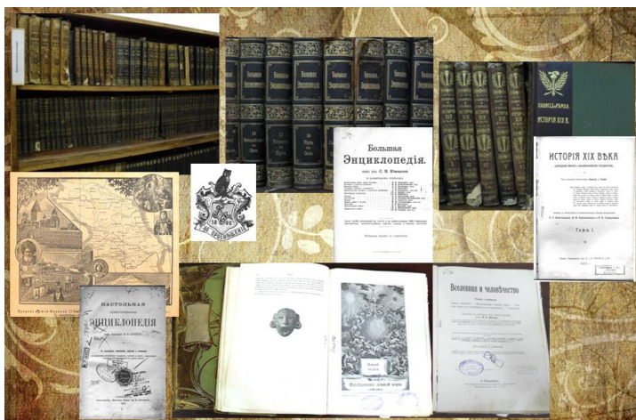
Рис. 3. Редкие справочные издания

Ядром ФРЦК нашей библиотеки являются справочные издания конца XIX – начала XX в. Это такие известные энциклопедии, как «Энциклопедический словарь» Брокгауза и Ефрона, «Энциклопедический словарь» Русского библиографического института Гранат, «Большая энциклопедия» под ред. С. Н. Южакова, «История XIX века: Западная Европа и внеевропейские государства» под ред. французских историков Лависса и Рамбо и др. (рис. 3).