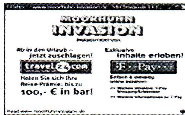
Рис. 1. Приклад реклами в комп'ютерній грі

Технологічна еволюція реклами у комп'ютерних іграх відзеркалює рух від статичних заставок на початку ігрового сеансу до цілісної історії, створеної для реклами товару. Нині статичні рекламні заставки залишилися тільки в малобюджетних проєктах. Переважно це безкоштовні додатки, в яких користувач погоджується з переглядом реклами, щоб отримати дозвіл на використання додатка (adware), як наприклад, це відбувається перед запуском он-лайн версії достатньо популярної гри Moorghuhn, коли користувач примушений передивлятися рекламну заставку Travel 24.com та T-Pay, щоб мати можливість розпочати гру (рис. 1). Такі ігри переважно поширюються безкоштовно.